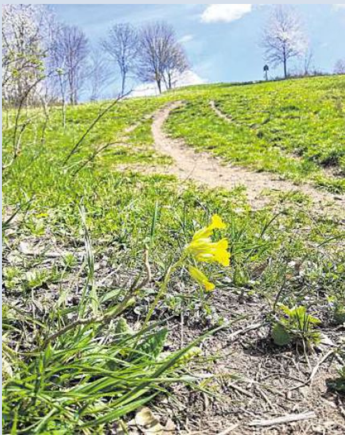
Das Fahrradfahren auf dem Staffelberg-Plateau und den Wiesen im Steilhangbereich ist nicht gestattet.