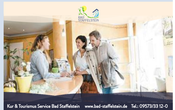
Kur & Tourismus Service Bad Staffelstein www.bad-staffelstein.de Tel.: 09573/33 12-0

auto reparatur SERVICE-CENTER GEORGE Meisterhaft GmbH Lichtenfelder Straße 38 96231 Bad Staffelstein Telefon 095 73 / 57 00