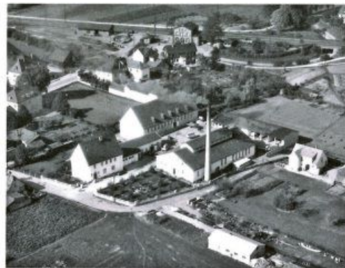
Der Milchhof von Staffelstein, 1957