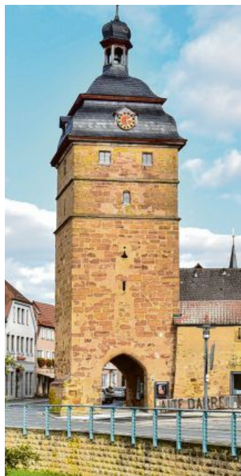
Die Kulturinitiative Bad Staffelstein setzt auch in den nächsten Monaten auf ein breit gefächertes Programm zwischen Kunst, Regionalgeschichte und Musik. Viele Veranstaltungen finden in der Alten Darre am historischen Stadtturm statt.