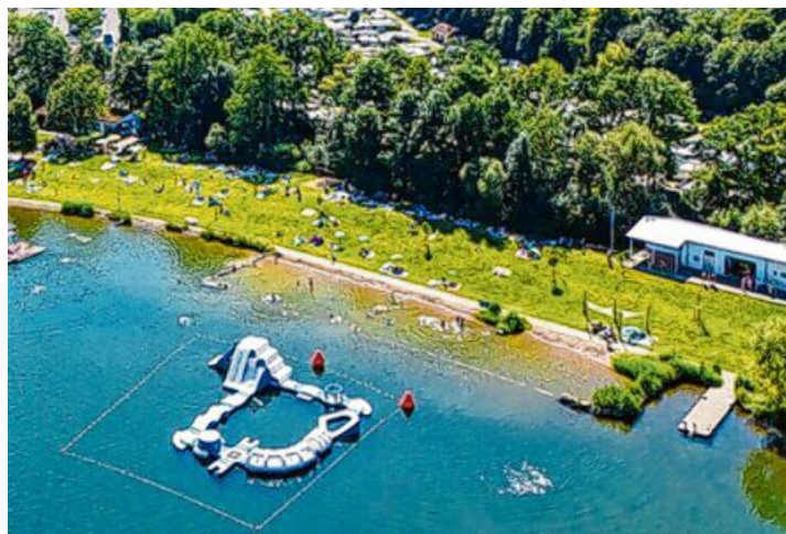
Erneut wurde der Ostsee ausgezeichnet.

Die „Blaue Flagge“ gilt europaweit als anerkanntes Qualitätssiegel für Badestellen und Sportboothäfen. Voraussetzung sind unter anderem eine ausgezeichnete Wasserqualität, hohe Sicherheitsstandards, eine gepflegte Infrastruktur sowie ein sensibler Um-