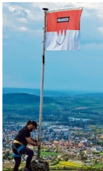
Dank des Einsatzes des Hissteams des „Fränkischen Bunds e.V.“ weht wieder eine Frankenfahne über dem Staffelberg.