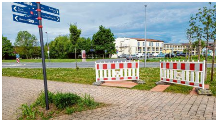
Platz gemacht: Hier soll die Ziffer 4 des Adam-Riese-Erlebnispfades stehen.