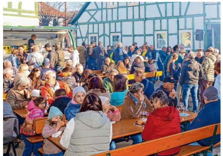
In Uetzling weiß man zu feiern.