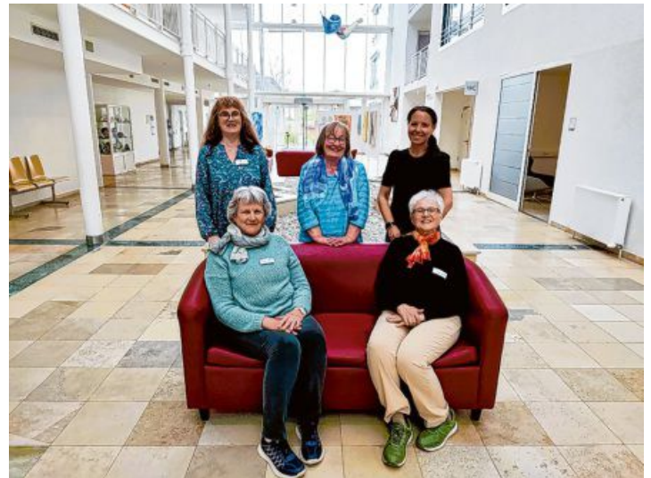
Der Besuchsdienst ist eine Kooperation zwischen der Ökumenischen Kur- und Urlauberseelsorge Bad Staffelstein und der Schön Klinik.

Vor nunmehr 30 Jahren fanden sich die ersten Frauen und Männer zusammen, um regelmäßig Patientinnen und Patienten der Schön Klinik zu besuchen. Eine langjährige Mitarbeiterin war sogar ganze 25 Jahre mit viel Freude dabei. Ein wertvoller Dienst, manchmal auch herausfordernd, immer sinnvoll. Der Besuchsdienst ist eine Kooperation zwischen der Ökumenischen Kur- und Urlauberseelsorge Bad Staffelstein und der Schön Klinik.