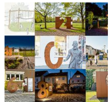
Freuen darf man sich auf den „Adam-Riese-Erlebnispfad“.

te, ebenfalls auf der Bahnhofstraße, kann man ab Ende Mai die 7 bewundern, weiter Richtung Viktor-von-Scheffel-Denkmal die 8. Für die 9 wurde ein Platz beim Stadtmuseum gefunden. Etwas Besonderes stellt die Zahl 0 dar. Sie steht nicht frei, sondern an der Außenwand der Bürger und Tourist Information neben dem Rathaus.