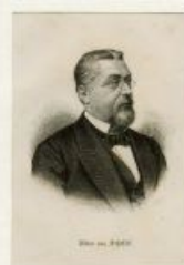
(Foto: Stadtarchiv Bad Staffelstein/ Stahlstich von Veit Froer, um 1870)

Informationen zur Datenerhebung gemäß Artikel 13 der Europäischen Datenschutz-Grundverordnung (DSGVO) erhalten Sie auf unserer Homepage unter www.bad-staffelstein.de/de/stadt/aktuelles/ stellenausschreibungen.de