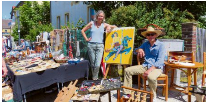
Stöbern, entdecken und ins Gespräch kommen: Der Flohmarkt in Bad Staffelsteins Innenstadt lädt zum entspannten Bummeln zwischen Trödel und Raritäten ein.

Ergänzt wird das Angebot durch kulinarische Vielfalt und familienfreundliche Aktionen. Regionale Genussanbieter und Foodtrucks sorgen für ein breites Spektrum an Speisen – von herzhaften Spezialitäten bis zu sü-