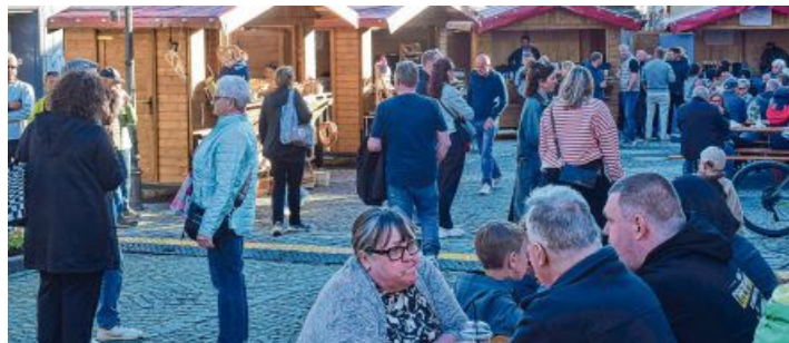
An den Buden herrschte reger Betrieb.

Der Geruch nach Bratwürsten und Steaks war verlockend, das Getränkeangebot gut, die Bänke, die man rund um das Rathaus aufgestellt hatte, waren schnell besetzt. Auch die angebotenen Kuchen, Waffeln, Kaffee und vieles mehr ließen sich die Gäste schmecken. Wer Lust hatte, konnte sich bei den Fieranten, die sich in die